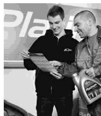
Oleje Orlen Oil należą do nowoczesnych produktów. To jakość sama w sobie

Asortyment firmy wzbogacono o nową linię olejów Platinum Classic, która jest oferowana do samochodów osobowych wyposażonych w silniki o zapłonie iskrowym oraz o zapłonie samoczynnym. Nowe produkty są sprzedawane w opakowaniach litrowych oraz 4,5-litrowych.