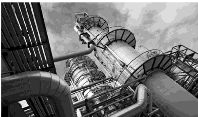
Największą rafinerią w Polsce jest ta znajdująca się w Płocku. Jednocześnie PKN Orlen dysponuje najliczniejszą siecią stacji benzynowych w naszym kraju