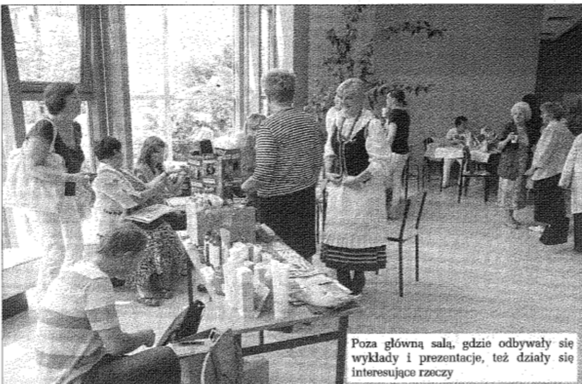
Poza główną salą, gdzie odbywały się wykłady i prezentacje, też działy się interesujące rzeczy

Już dziś zapraszamy wszystkie panie na następne forum. Wystarczy wyjść z domu, zachęcić do tego samego przyjaciółkę i wybrać